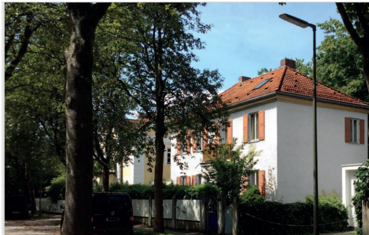
Die zu sanierende Villa auf dem vorderen Grundstück

Auf dem vorderen Grundstück steht ein Einfamilienhaus aus dem Jahre 1899, welches selbst nicht als Einzeldenkmal in der Denkmalliste geführt wird. Erste Gespräche mit der Denkmalschutzbehörde haben jedoch schon ergeben, dass dieses Gebäude seitens der Behörden als erhaltenswürdig eingestuft wird.