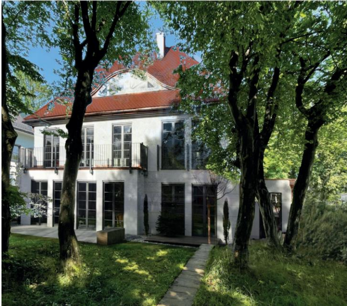
Geplante Walmdach Villa auf dem hinteren Grundstück