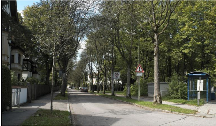
Blick in die Rubensstraße

Die Rubensstraße, in der die beiden Grundstücke erworben wurden, liegt in der Villenkolonie Pasing II in Obermenzing. Die Idee zur Villenkolonie westlich der Würm kam ursprünglich von dem Architekten und Bauplaner August Exter. In unmittelbarer Nachbarschaft finden sich denkmalgeschützte Villen, die prägend für das Stadtbild sind.